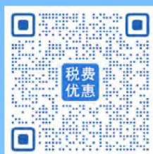
税费优惠政策专栏